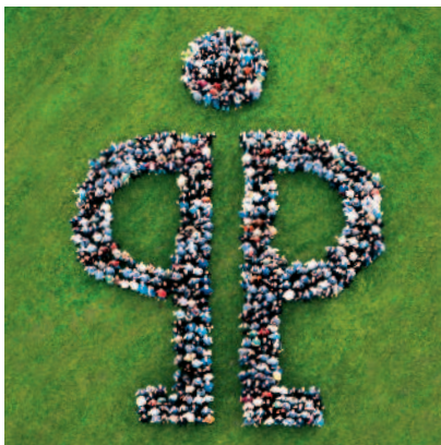
Plus de 1600 salariés Pöppelmann se portent garant de la productivité, de la qualité et du niveau de service.

Le domaine de compétence Pöppelmann KAPSTO® développe et produit plus de 3 000 références de protecteurs plastiques. Filetages, taraudages, alésages, tubes, tuyaux, axes, brides, etc. sont protégés efficacement par des bouchons et capuchons issus du programme standard KAPSTO® pendant la production, le transport, le stockage et la phase de mise en peinture. Tous les articles du programme KAPSTO® sont livrables sur stock. Sur demande, nous développons et produisons pour vous des exécutions spéciales.