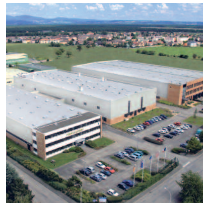
France : Plastiques Pöppelmann France S.A.S., Rixheim