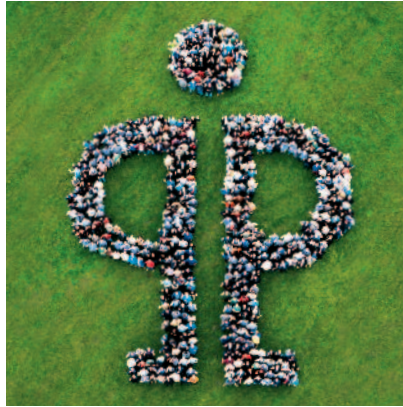
Über 1.600 „Pöppelmänner und Pöppelfrauen“ stehen für Produktivität, Qualität und Service.

Der Kompetenzbereich Pöppelmann KAPSTO® entwickelt und produziert Kunststoff-Schutzelemente in über 3.000 Ausführungen. Innen- und Außengewinde, Bohrungen, Rohre, Schläuche, Bolzen, Flansche usw. werden mit Kappen und Stopfen aus dem KAPSTO®-Normprogramm während Produktion, Transport, Lagerung und Lackierung zuverlässig geschützt. Alle Artikel aus dem KAPSTO®-Normprogramm werden aus Lagervorrat geliefert. Auf Wunsch entwickeln und produzieren wir für Sie maßgeschneiderte Sonderanfertigungen.