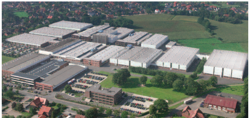
Deutschland, Werk I: Pöppelmann GmbH & Co. KG, Kunststoffwerk-Werkzeugbau, Lohne