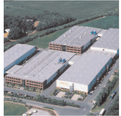
Deutschland, Werk II: Pöppelmann Kunststoff-Technik GmbH & Co. KG, Lohne.